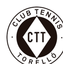
Club Tennis Torelló