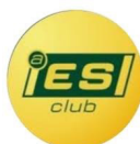
Emilio Sánchez Club Esportiu