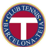
Club Tennis Teià Barcelona